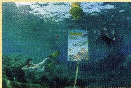
Sentier Sous-Marin à Port Cros