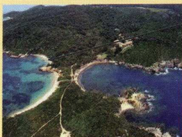
La Presqu'île du Langoustier