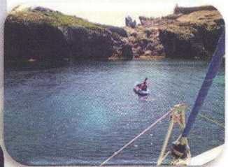
Découvertes en kayak