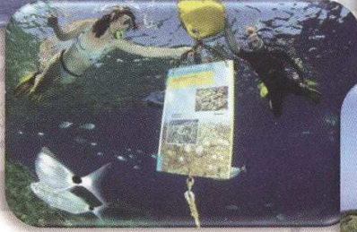
Sentier sous-marin à Port Cros