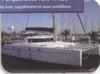
Le « Sainte Angèle » Fontaine-Pajot Bêlize 43' Longueur: 14 m